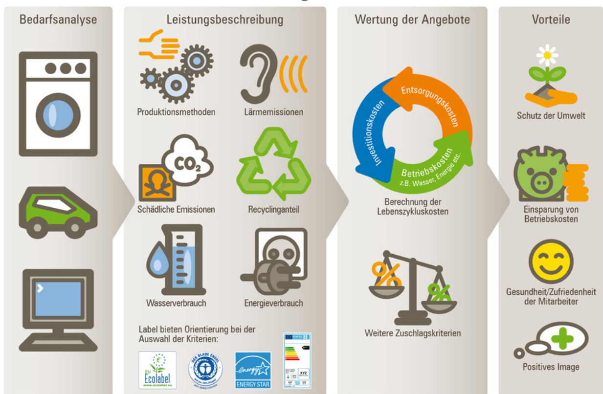
Abbildung 1: Schematischer Überblick über Umweltaspekte im Vergabeverfahren, Berliner NetzwerkE ( www.berliner-netzwerk-e.de )