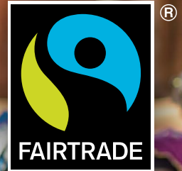
Das Siegel für fairen Handel